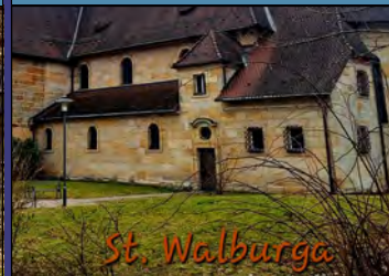
Mi 25.02.2026 Über den Tuchersteig