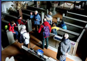
Sa 21.02.2026 Vom Fembach zur Aurach