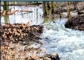
Mi 25.02.2026 Gemütlich ins Klosterdorf Engelthal