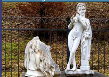
Do 26.02.2026 Greding, Tor zum Naturpark Altmühltal