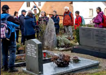
Sa 28.02.2026 Zu Günter Strack nach Münchsteinach