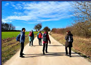
Mo 02.03.2026 Auf der Höhe entlang des Fembachs