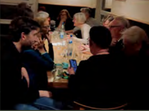
Fotos Nizza/Seealpen 0326: Groß: Blick über die italienische Nordseite zum Pass Richtung Osten. Im Hintergrund Cima d'Orgials (2647m) und Cime de la Lombarde (2800m) | Rund v.o.n.u.: Cime du Gélas (3143m) / Im Nationalpark Mercantour der Mont Bego / Nizza Promenade am Palais de la Jetée , Fotografie um 1880 Gesprächsrunde: Wandervereine planen gegenseitige Besuche.