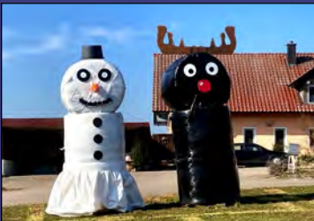
Mi 04.03.2026 In den Rangau