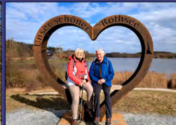
So 01.03.2026 Zum Rothsee