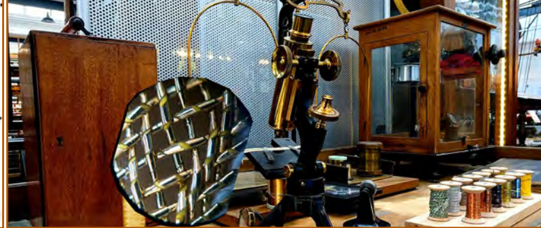
Bericht vom Do 10.04. bV Kulturausflug: Roth, die Stadt der Drahtzieher ( WF Burgl Hübner )